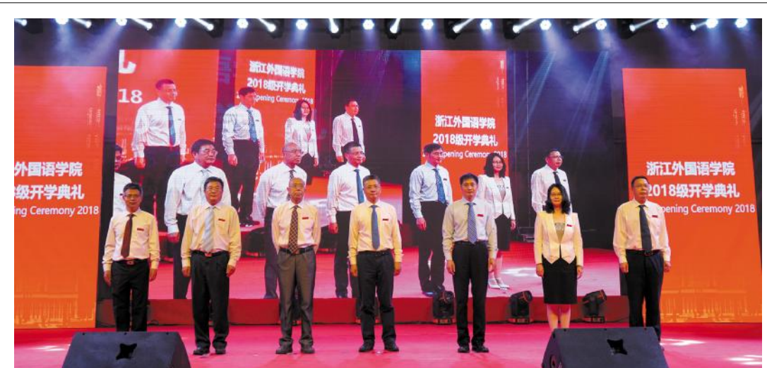
9月16日晚,我校“山水一程,筑梦浙外”2018级新生开学典礼在行健馆隆重举行。典礼分为仪式部分、特色介绍和迎新晚会等三个篇章。校党委书记宣勇、校长洪岗等校党政领导班子成员出席典礼。图为校党政领导班子成员出席典礼。

学校将继续弘扬“明德弘毅 博雅通达”的校训,以迎接本科教学工作审核评估为新的挑战,全面落实学校的十三五发展规划,坚持特色发展、内涵发展,为全面建成外语特色鲜明、教育品质一流的多科性普通本科高校继续努力!