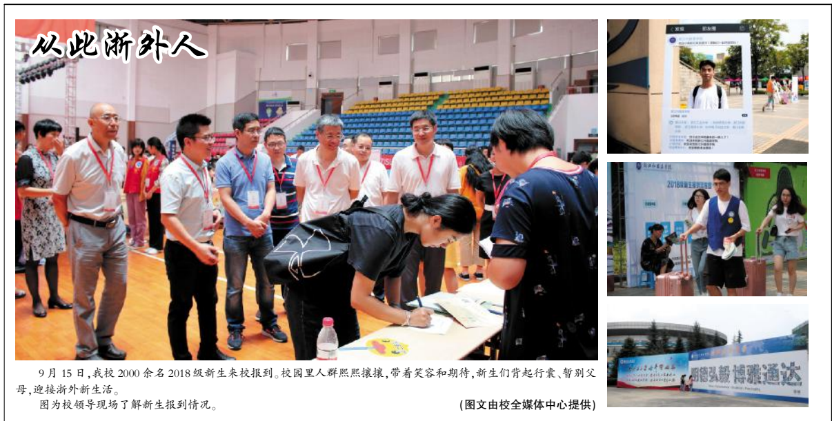
9月15日,我校2000余名2018级新生来校报到。校园里人山人海,带着笑容和期待,新生们背起行囊,暂别父母,迎接浙外新生活。图为校领导现场了解新生报到情况。