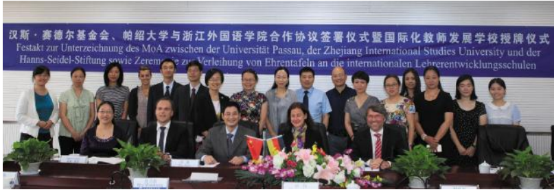
汉斯·赛德尔基金会、帕绍大学与我校签署三方合作协议

第一次党代会以来，学校认真贯彻落实习近平总书记关于教育服务经济社会发展的重要讲话精神，按照“十三五”社会服务与创业规划，积极对接我省“一带一路”枢纽行动计划。围绕我省大湾区大花园大通道大都市区总体部署，以服务区域经济社会发展需求为导向，以学科专业优势特色为基础，立足传统培训优势，巩固月刊社优势领域，打造国际志愿者品牌，进一步加强浙外智库建设，不断创新业务形式与内容，建章立制、搭建平台、整合资源，产学研合力初显成效，社会服务能力持续提升。