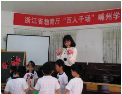
“百人千场”送教活动