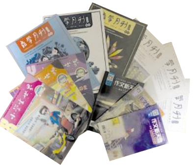
三刊一报：《教学月刊·中学版》《教学月刊·小学版》《作文新天地》和《小学生世界》报

“三刊一报”的质量和社会影响力不断提升：《教学月刊·中学版》、《教学月刊·小学版》再次双双入选“人大复印报刊资料”基础教育类重要转载来源期刊（全国仅50家相关期刊入选），中小学各学科在“人大复印报刊资料”的全文转载量继续名列前茅；还双双被中国期刊协会推荐入选“2017年中小学图书馆馆配期刊”目录。《小学生世界》报再次入选国家新闻出版广电总局2017年度向全国少年儿童推荐的百种优秀报刊。《教学月刊·中学版》围绕教育、教学热点、难点、重点问题抓选题，推出了配合教育厅的“新高考”“新课程”等一系列专题，深受广大教育工作者的关注和欢迎。