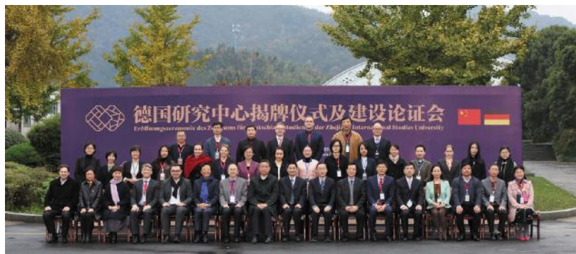
德国研究中心揭牌仪式

学校社会服务的全面繁荣，需要较长的培育周期，今后学校将加强规划、指导与管理，以服务区域经济社会发展需求为导向，以学科专业优势特色为基础，搭建平台、整合资源、制定标准、形成品牌。相信随着学校社会服务工作的政策环境和工作思路逐渐改善，社会服务工作将逐渐走向全面繁荣。