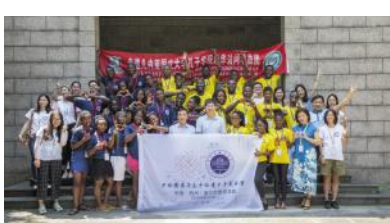
赤道几内亚孔子学院学生团组来校

逐步提高人、财、物方面的综合保障能力。学校在教学资源有限的情况下，对国际化工作持续加大投入。