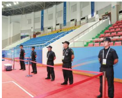
第十三届全国学生运动会安保

新时代的历史画卷已然铺展开来,党的十九大报告处处以人民福祉为出发点和落脚点,“坚持在发展中保障和改善民生”“保证全体人民在共建共享发展中有更多获得感”等重要论述振奋鼓舞,我们要继续不忘初心,牢记使命,办好人民满意的教育,办好师生满意的学校,让浙外成为广大师生共同的美好家园。