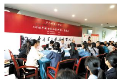
《习近平的七年知青岁月》导览会

加强培训，强化队伍建设。 管好用好、配齐建强全校宣传战线队伍建设，建立宣传联络员机制，开展各类业务培训，提高宣传战线队伍能力水平。加强全媒体中心等学生队伍的能力提升，为学生营造了一个积极向上、组织合理、高效有序的集体，已成为学生成长成才良好的实践平台。面向全校，专门组织开展了“党的十九大精神宣传能力提升”“推进传播能力建设，提升浙外知名度美誉度”等系列业务培训，邀请知名媒体记者、相关领域专家进行互动交流，全面提升学校宣传队伍的能力水平。