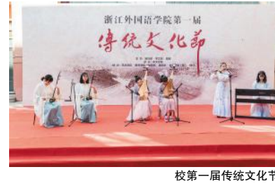
校第一届传统文化节

西藏民族中学开展“青年学子学青年习近平”夏令营活动。艺术学院党总支组织学生与浙江工业大学附属实验学校开展“青年学子学青年习近平”学习教育实践。 学习教育得到了上级领导和有关部门的高度重视与关心指导。 省委书记车俊批示指出，浙江外国语学院党委在学生中开展这项“青年学子学青年习近平”主题教育实践活动很有意义。浙江高校“青年学子学青年习近平”教育实践活动座谈会在我校召开，浙江省委常委、原宣传部长葛慧君对我校开展“青年学子学青年习近平”学习教育表示赞赏。浙江高校青年学生“学十九大精神，做时代弄潮儿”座谈会在我校召开，十九大代表、省教育工委原书记何杏仁来我校宣讲十九大精神，我校学生代表参加了学习教育的体会。校党委书记宣勇赴京参加中央党校出版社《习近平的七年知青岁月》出版仪式座谈会并发言。学习教育引起中央政策研究室、教育部思政司、省委宣传部、省委教育工委等上级部门重视和支持。《学习时报》、教育部思政司简报、《浙江新闻联播》、《浙江日报》、《浙江教育报》、省委宣传部的“之江吹风”公众号、浙江在线、新浪浙江、《杭州日报》等媒体纷纷报道我校开展“青年学子学青年习近平”学习教育。