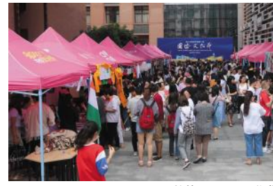
校第一届国际文化节