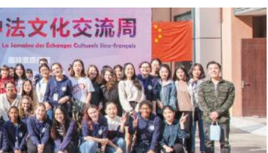
汉语桥秋令营学生参加中法文化交流周

重点引进海外博士和有海外经历的教师，通过举办校内主题培训班、组派培训团赴境外培训等方式提高干部的国际视野与国际化管理水平。教师出国境培养进修、外国文教专家聘请、国际化专业和全英文课程建设、管理干部队伍建设等专项经费逐年递增。整修了文三校区和小山新校区的留学生公寓、外教公寓，开设清真餐厅，有效改善了外国师生的校园体验。