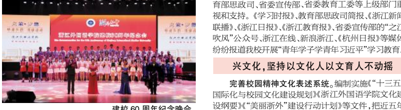
建校60周年纪念晚会

的校园文化建设外化于形，细化于目。挖掘校园文化内涵，建立和完善以校标、校训、校旗等要素集成的精神文化表述系统。创作《浙外校歌》，摄制学校纪念专题片和学校宣传片，在学校官微上首播后，点击量已经超过2万5千次。设计制作学校宣传画册，对学校各个方面进行了全面介绍，扩大社会影响。