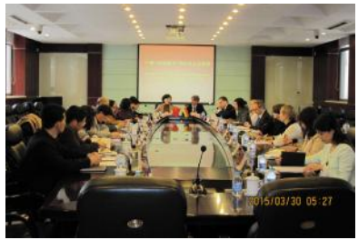
中德“环境教育”项目备忘录签署

成果转化型科研服务提升内涵。成果转化型服务由单纯重视纵向科研，向纵向、横向科研并重转变，由单纯重视项目申报向同时重视完成项目并取得高水平成果转变。横向课题、经费等持续保持高速发展势头。在横向项目来源方面，除政府部门委托之外，来自科研机构及企业的项目数量不断增加，所占比例不断提高。最终成果不再是单一的咨询报告形式，服务形式更加多样化，包含了培训、咨询报告、策划方案、技术服务、艺术设计等多个方面。学校教师