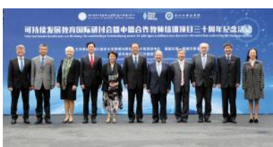
学校承办中德合作教师培训项目三十周年纪念活动

第一次党代会以来，为提高学校服务国家外交战略、科教兴国战略、人才强国战略的能力，学校充分认识建设国际化特色高校的意义与作用，将国际化融入人才培养全过程，纳入到学校的管理理念、管理制度和行为规范，努力提升服务“人才培养”这一中心工作的能力。经过三年的探索与积累，2016年学校形成国际化特色高校建设的工作目标，研究部署未来五年教育国际化的主要任务，进一步统一思想，凝心聚力，扎实推进国际化特色高校建设，为实现学校“十三五”发展的战略目标奠定坚实基础。